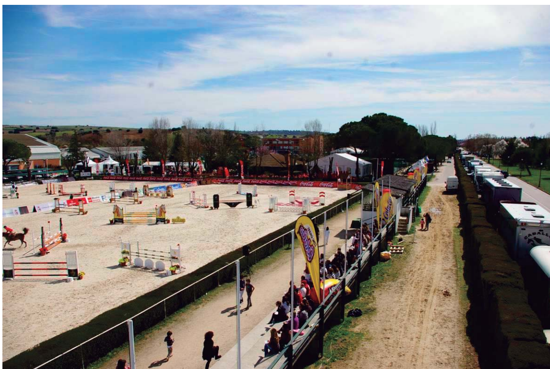
Pista central del UCJC SPORTS CLUB situado en el Campus Universitario de la UCJC en Villafranca del Castillo

La Universidad Camilo Jose Cela y el Consejo Superior de Deportes os dan la bienvenida al V Campeonato de España Universitario de Hípica . La competición se va a celebrar en las instalaciones hípcas del UCJC SPORTS CLUB, ubicado en el Campus de la Universidad Camilo Jose Cela de Villanueva de la Cañada (Madrid).